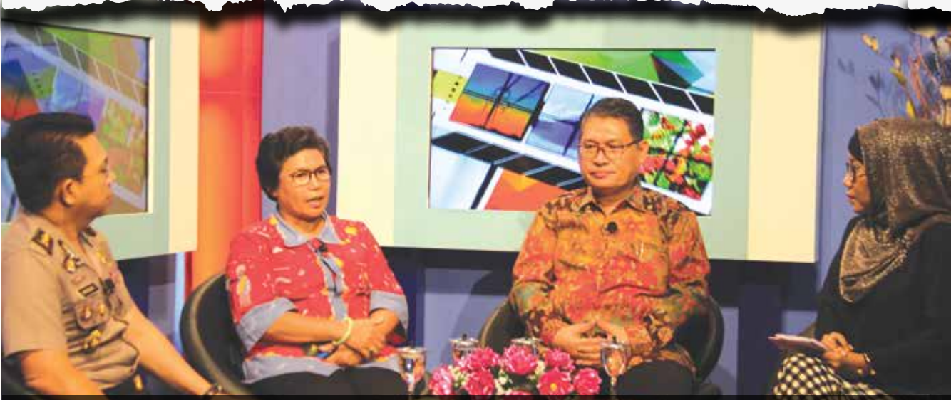
Ketua dan Wakil Ketua LPSK beserta Kabiro Hukum Polda Lampung melakukan sosialisasi melalui talkshow di TVRI Lampung.