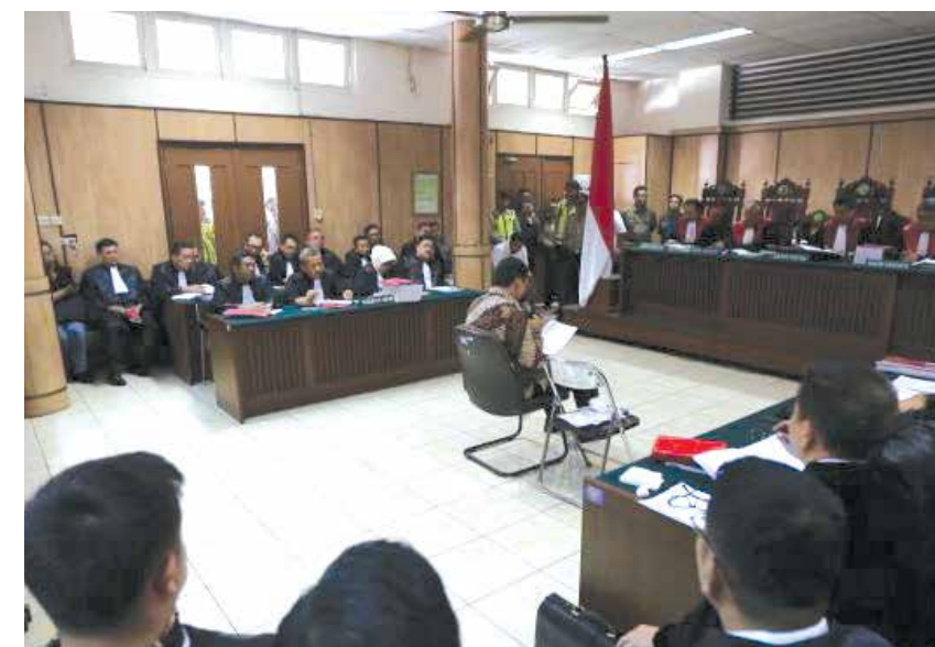
Sidang dugaan penistaan agama.

Sesuai Pasal 10 Undang-Undang Perlindungan Saksi dan Korban,