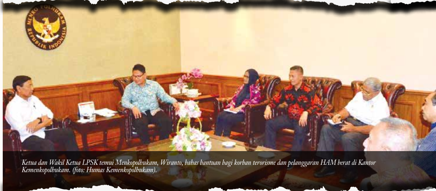
Ketua dan Wakil Ketua LPSK temui Menkopolkabukam, Wiranto, membahas bantuan bagi korban terorisme dan pelanggaran HAM berat di Kantor Kemenkopolkabukam.