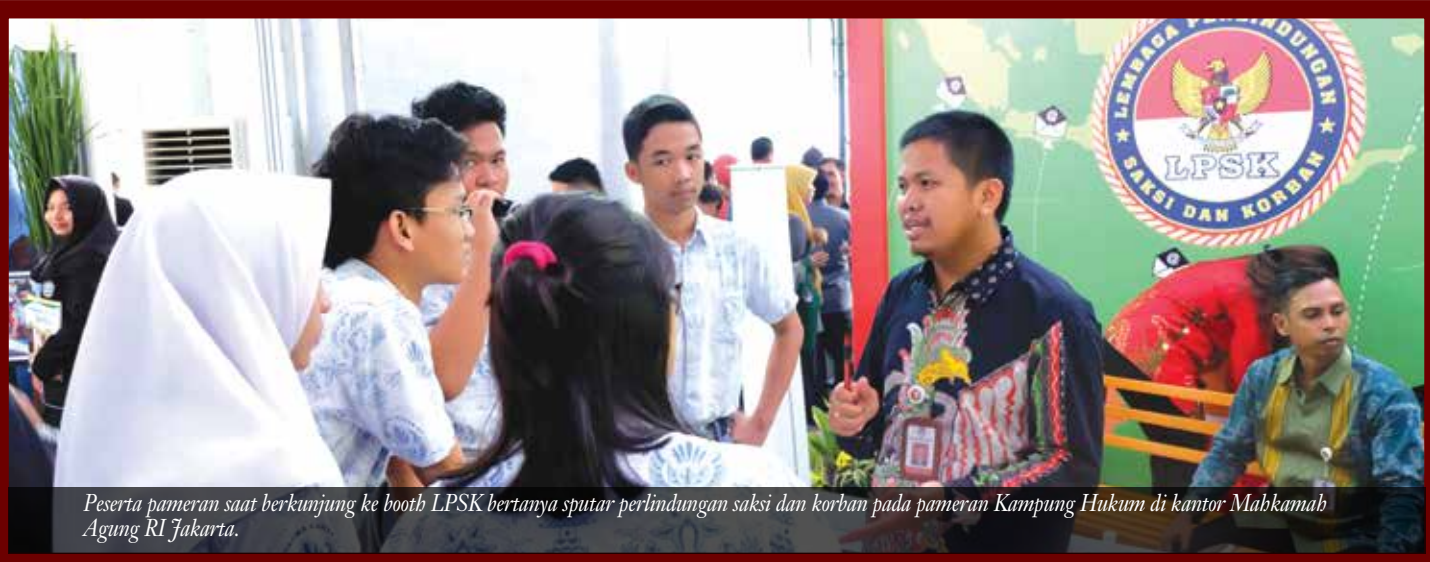
Peserta pameran saat berkunjung ke booth LPSK bertanya sputar perlindungan saksi dan korban pada pameran Kampung Hukum di kantor Mahkamah Agung RI Jakarta.