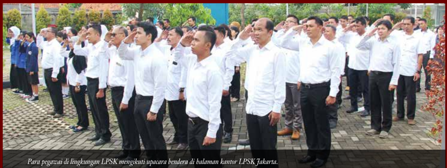
Para pegawai di lingkungan LPSK mengikuti upacara bendera di balaman kantor LPSK Jakarta.