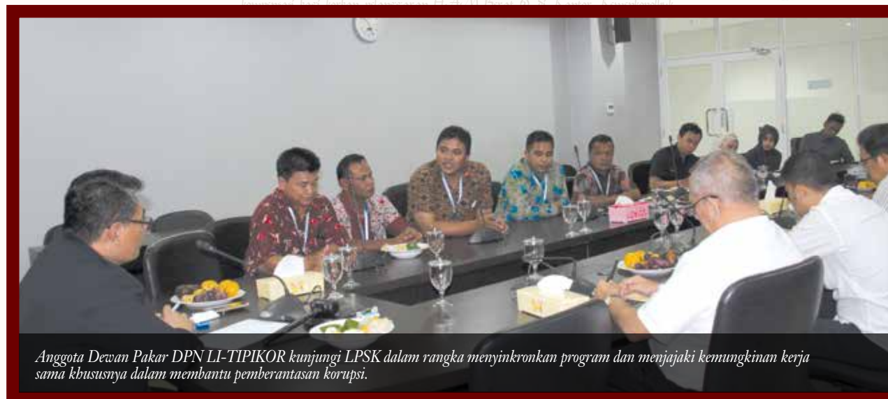
Anggota Dewan Pakar DPN LI-TIPIKOR kunjungi LPSK dalam rangka menyinkronkan program dan menjajaki kemungkinan kerja sama khususnya dalam membantu pemberantasan korupsi.