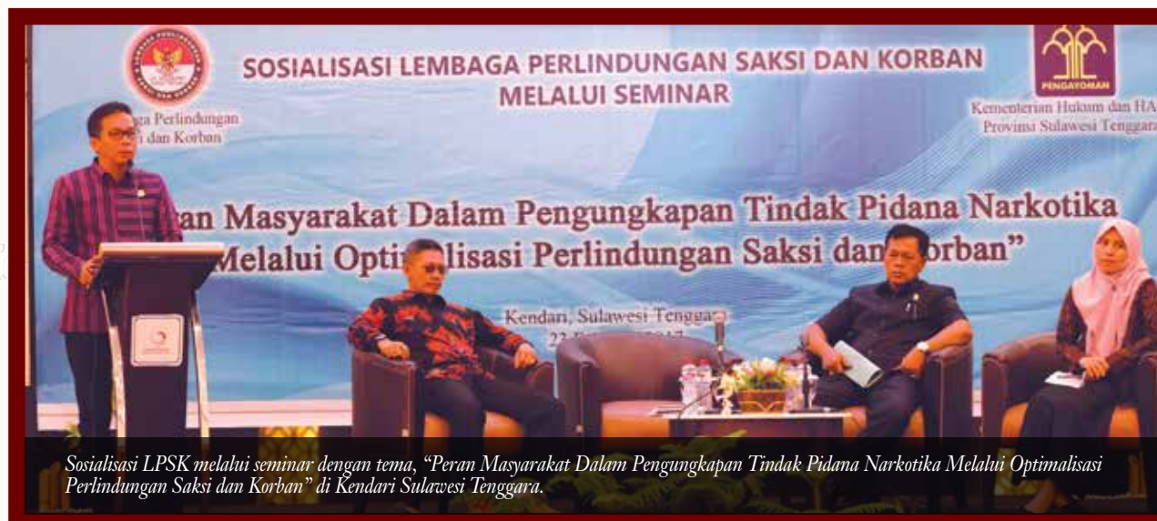
Sosialisasi LPSK melalui seminar dengan tema, "Peran Masyarakat Dalam Pengungkapan Tindak Pidana Narkotika Melalui Optimalisasi Perlindungan Saksi dan Korban" di Kendari Sulawesi Tenggara.