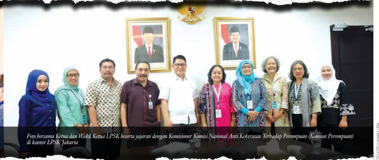
Foto bersama Ketua dan Wakil Ketua LPSK beserta jajaran dengan Komisioner Komisi Nasional Anti Kekerasan Terhadap Perempuan (Komnas Perempuan) di kantor LPSK Jakarta